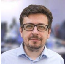
Arturo Marimón AM Consultores