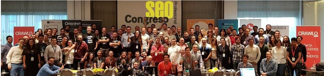
Más de 120 asistentes en la edición anterior del Congreso SEO Profesional

El 9º Congreso SEO Profesional se celebra en Madrid el sábado 30 de junio de 2018, en el Hotel Nuevo Madrid .